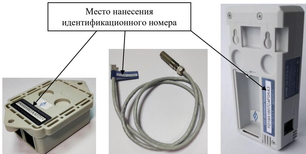
Рисунок 4 – Место нанесения идентификационного номера

1.1.6.3 Место нанесения идентификационного номера датчика показано на рисунке 4.