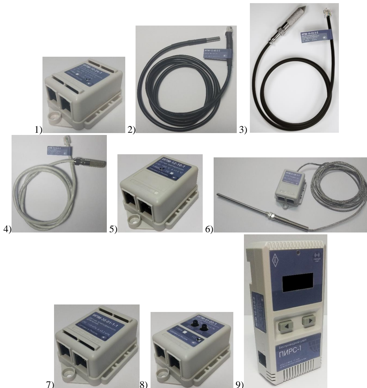
Рисунок 2 –Общий вид климатических датчиков ИПМ

1) Вид датчика ИПМ-10, ИПМ-12 в пластмассовом корпусе; 2) вид датчиков ИПМ-10, ИПМ-11, ИПМ-12 в металлическом малогабаритном корпусе; 3) ) вид датчиков ИПМ-10, ИПМ-11, ИПМ-12 в металлическом корпусе «фильтр»; 4) вид датчиков ИПМ-10, ИПМ-11, ИПМ-12 в металлическом корпусе «фильтр с креплением»; 5) вид датчика ИПМ-12 в пластмассовом корпусе; 6) вид датчика ИПМ-21; 7) вид датчика ИПМ-30; 8) вид датчика ИПМ-41; 9) вид датчика ИПМ-10, ИПМ-11, ИПМ-12, ИПМ-30, встроенного в совместимое устройство ПИРС